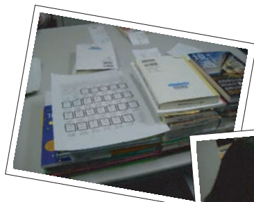
検本して蔵書印を押したり

さて、選書ツアーはここで終わりではありません。ここからがクライマックス！続々と納品される本を、図書館スタッフがデータを登録し、装備していきます。