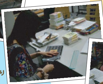
ラベルを貼ったり本全体を覆うラッピングをしたり