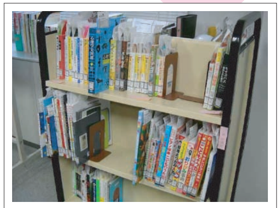
完成！ようやく貸出可能に。貸出ができるようになるまで、様々な過程を経ているのです。

貸出可能となった後、まず、選書してくれた参加者に優先的に貸出を行います。そして、それぞれ、おすすめ本のPOPコメントを書いていただき、選書したすべての本とともに展示します。これでいよいよお披露目となるのです。ここから、ツアー参加者以外にも貸出できるようになります。